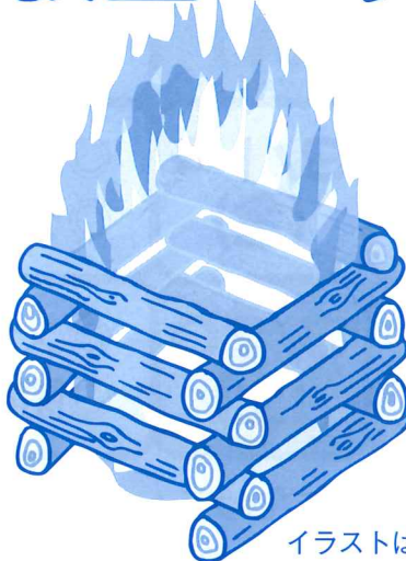
イラストはイメージです