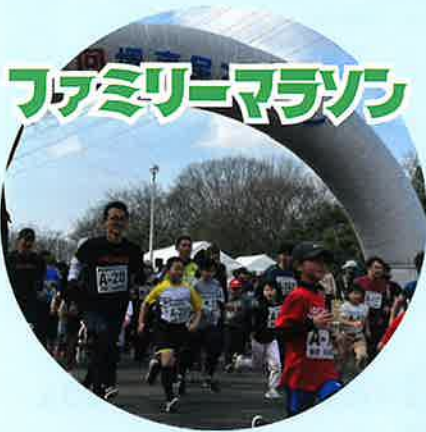
ファミリーマラソン

堺市民マラソンは、第53回を迎える歴史あるマラソン大会です。 豊かな自然に囲まれた大泉緑地を舞台に 「はじめての参加」から「記録への挑戦」をされる方まで さまざまなランナーが楽しめるイベントです。